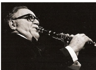
Goodman 1971 in Nürnberg

Benny Goodman machte mit diesem Erfolg quasi über Nacht den Jazz salonfähig und verschaffte ihm zunehmende Akzeptanz auch in den feineren Kreisen. Neben seiner Big Band, gründete er auch das Benny-Goodman-Quartett, das Jazz-Legenden vereinte. In diesem Quartett spielten mit Teddy Wilson und Lionel Hampton zwei schwarze Musiker zusammen mit zwei weißen Musikern, was zur damaligen Zeit ein Tabu war.